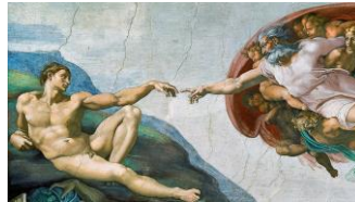
„Die Erschaffung des Adam“, Michelangelo, Sixtinische Kapelle, Vatikan